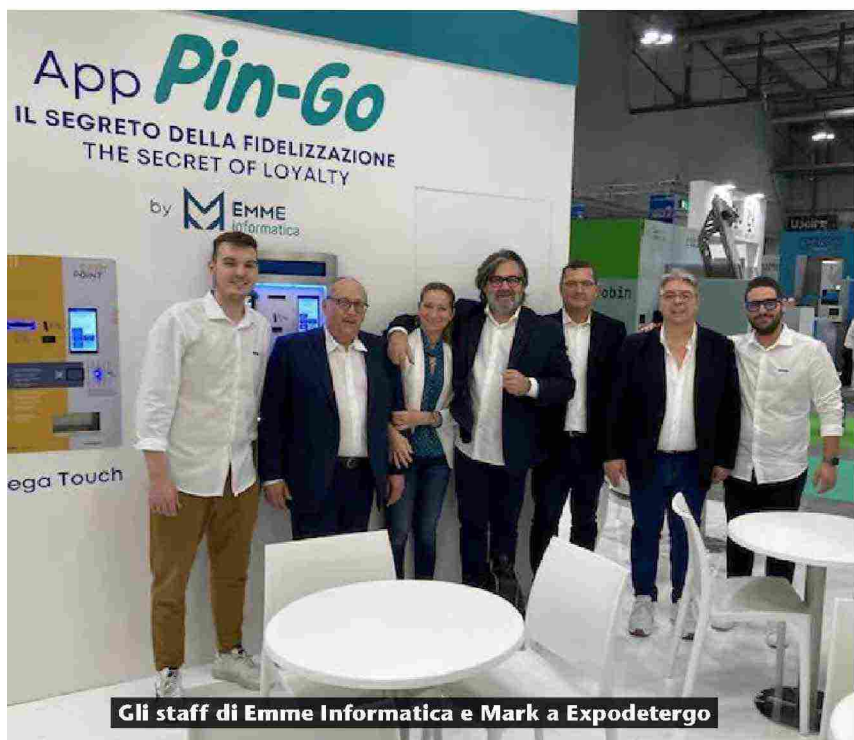
Gli staff di Emme Informatica e Mark a Expodetergo