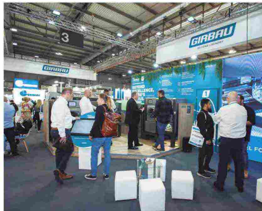
Girbau aprovechó la cita para presentar su nueva gama de lavadoras inteligentes Genius. Ofrecen altas revoluciones de centrifugado, un notable ahorro de agua y detergente y conectividad a través del software de control remoto Sapphire, que permite gestionar el funcionamiento de la lavandería a distancia. A nivel industrial, la marca exhibió las últimas novedades en tren de planchado y plegadores de toallas. Los visitantes pudieron ver, de primera mano, el funcionamiento de estas soluciones.

Pero los detergentes también hacen una contribución esencial. La tecnología del ozono utilizada en combinación con productos químicos innovadores mejora la eficiencia del lavado: se reduce el tiempo, se trabaja a bajas temperaturas (lavar a 15 grados es suficiente) y se reduce el consumo eléctrico, con un ahorro de hasta el 80%.